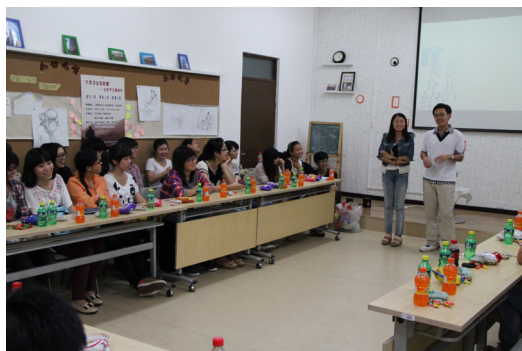
社工 12 &amp; 社工 13