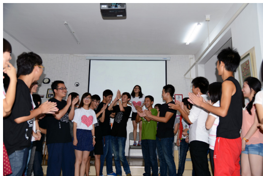
社会 12 &amp; 社会 13