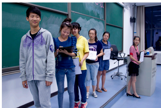
心理 12 &amp; 心理 13